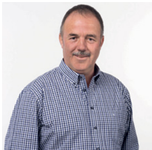
Moor Christian Landwirt SVP

Für eine nachhaltige und produzierende Land- und Alpwirtschaft, braucht es Politiker aus der Praxis.